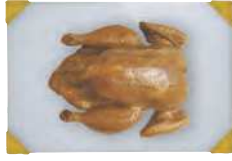
Raw poultry Carne de aves cruda