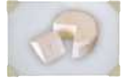
Bread and cheeses Panadería y quesos