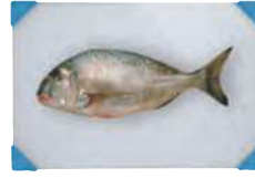
Raw fish Pescado crudo