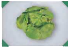
Fruit and vegetables Frutas y hortalizas