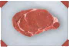
Raw meat Carne cruda